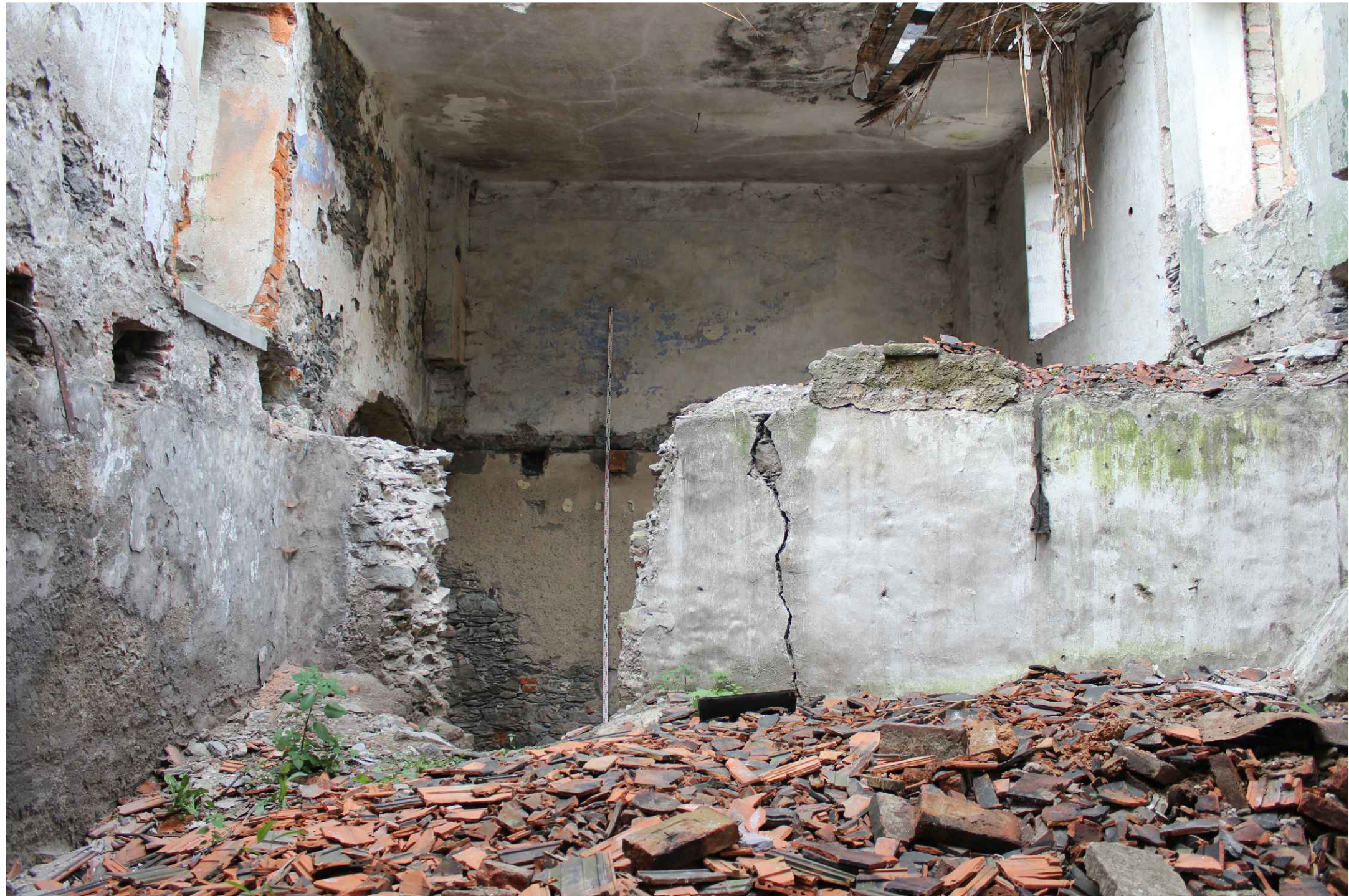
POHĽAD VÝCHODNÝ, ŠIKMÁ STENA