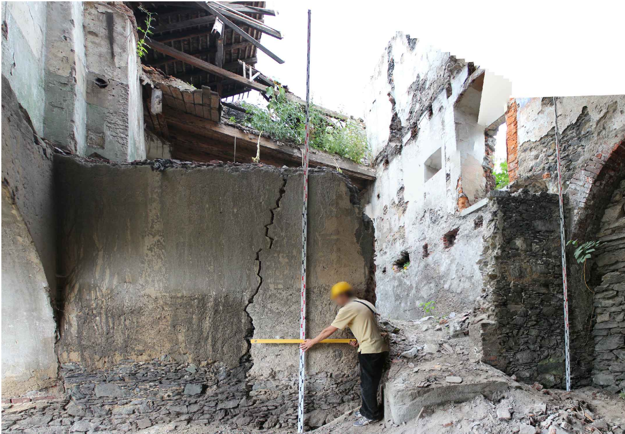
POHĽAD ZÁPADNÝ, ŠIKMÁ STENA